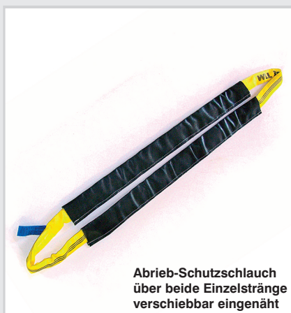
Abrieb-Schutzschlauch über beide Einzelstränge verschiebbar eingenäht

Gewebe-Schutzschläuche für Rundschlingen innen gummiert, außen rot oder blau beschichtet